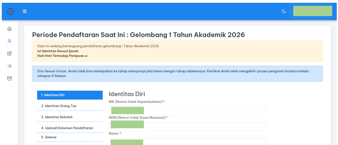
Gambar 5 Tampilan Menu Biodata peserta

Isikan data sesuai dengan data dukung yang diperlukan. Terdapat lima menu yang perlu dilengkapi. Pengisian data tersebut wajib berurutan dari pengisian identitas diri, identitas orang tua, identitas sekolah, dokumen pendaftaran, sampai dengan menu selesai. Saat mengisi data, pastikan semua field isian terisi dengan benar kemudian klik tombol “simpan” pada menu di akhir isian setiap tampilan seperti pada gambar berikut.