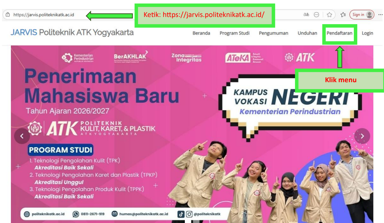
Gambar 1 Tampilan Website Jarvis.politeknikatk.ac.id

Pendaftaran Mahasiswa Baru Politeknik ATK Yogyakarta “Kelas Industri Beasiswa Kabupaten Magetan” dilaksanakan melalui website JARVIS Politeknik ATK Yogyakarta. Waktu pendaftaran diselenggarakan pada tanggal 1-10 Desember 2025. Sistem pendaftaran dapat diakses di https://jarvis.politeknikatk.ac.id/ seperti gambar berikut.